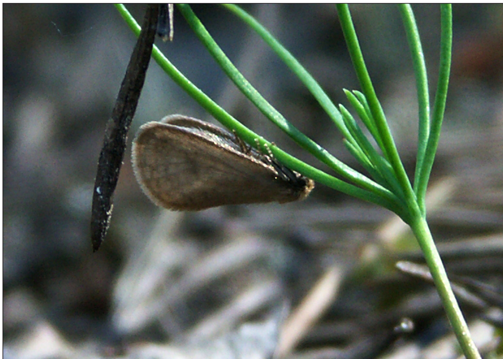
Ryc. 2. Bijugis bombycella (DENIS & SCHIFFERMÜLLER, 1775), Piła, VI 2010.