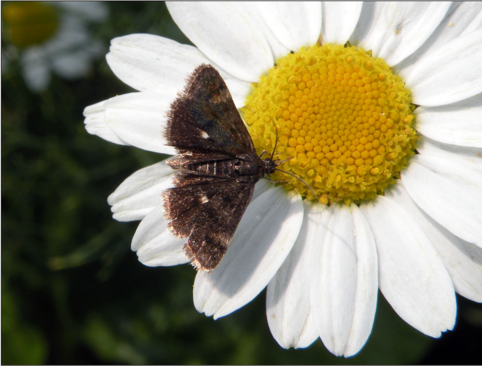
Ryc. 7. Heliothela wulfeniana (SCOPOLI, 1763), Pleszew, VII 2012.