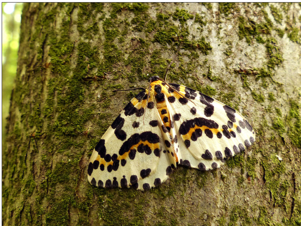
Ryc. 10. Abraxas grossulariata (LINNAEUS, 1758), Piła, VII 2016.