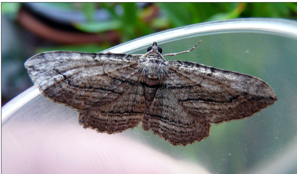
Ryc. 11. Horisme corticata (TREITSCHKE, 1835), Pleszew, VIII 2009.

Fig. 11. Horisme corticata (TREITSCHKE, 1835), Pleszew, VIII 2009.