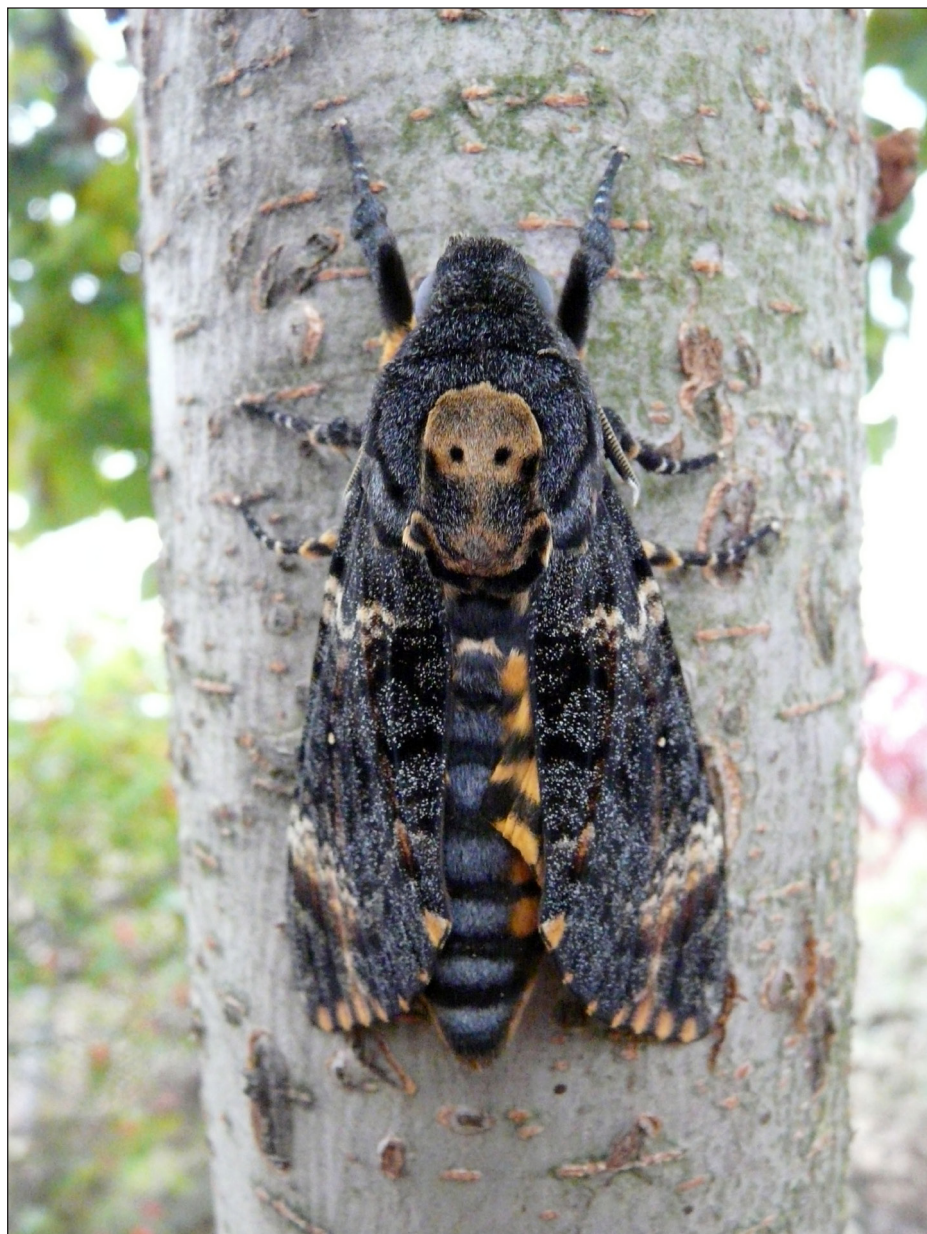
Ryc. 8. Acherontia atropos (LINNAEUS, 1758), Żbiki, X 2020 (fot. P. Żurawlew).