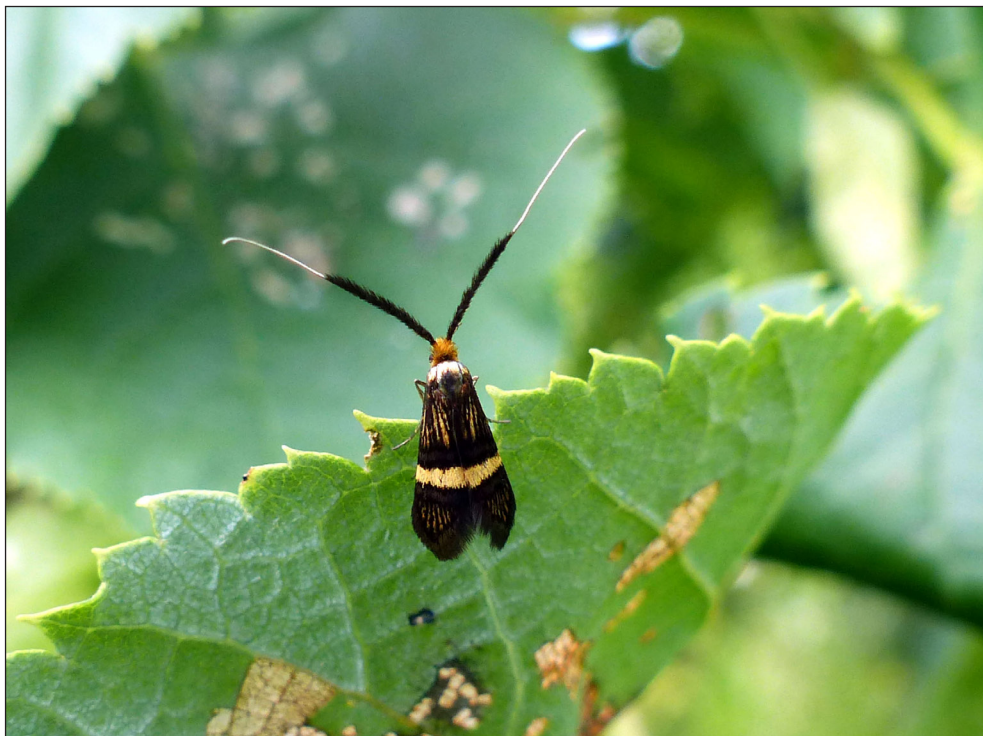
Ryc. 1. Adela croesella (SCOPOLI, 1763), Piła, VI 2014.

Fig. 1. Adela croesella (SCOPOLI, 1763), Piła, VI 2014.