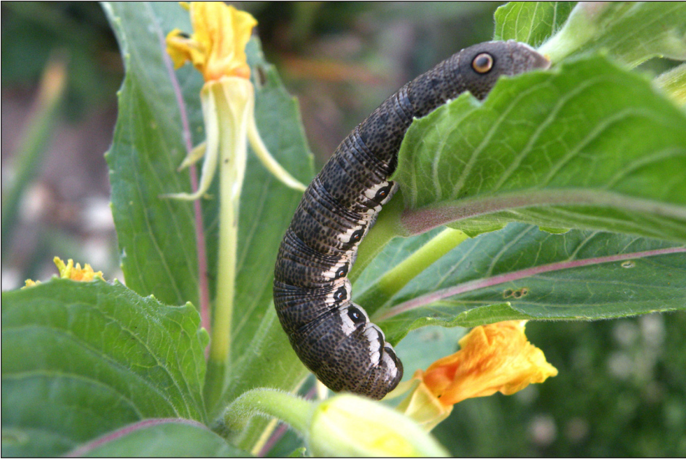
Ryc. 9. Proserpinus proserpina (PALLAS, 1772), gąsienica, Pleszew, VII 2011.