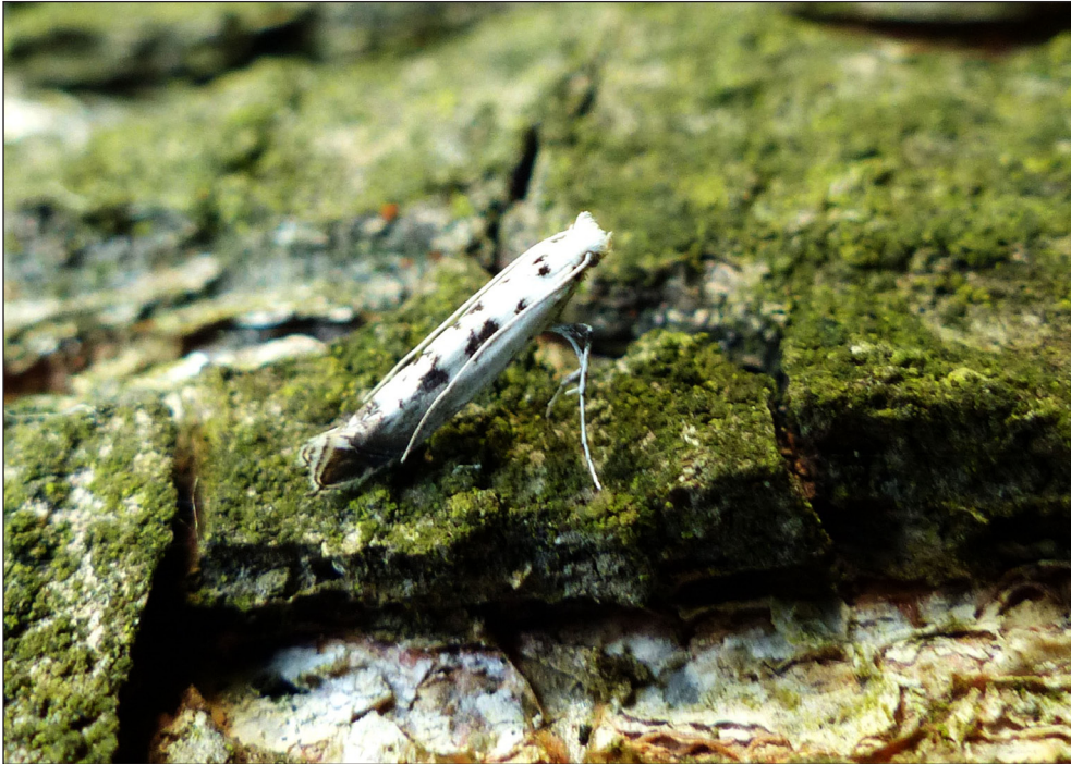
Ryc. 3. Ornixola caudulatella (ZELLER, 1839), Piła, VI 2016.