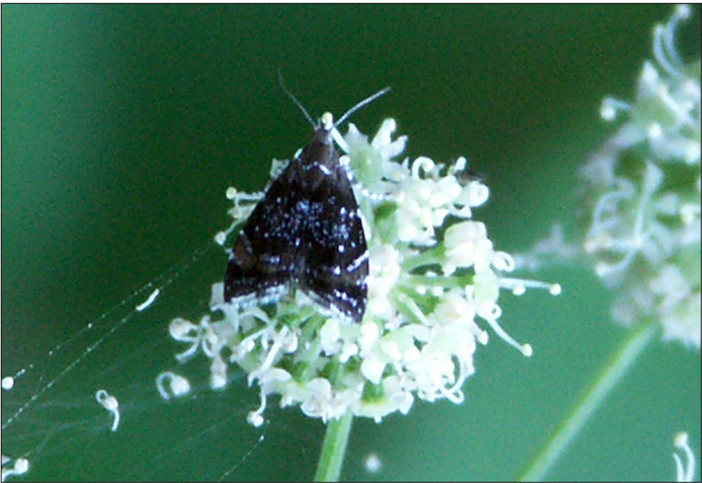
Ryc. 6. Prochoreutis sehestediana (FABRICIUS, 1776), Piła, IX 2013.