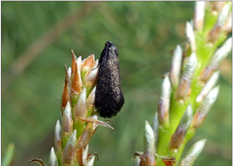
Ryc. 4. Lypusa maurella (DENIS & SCHIFFERMÜLLER, 1775), Piła, V 2020.