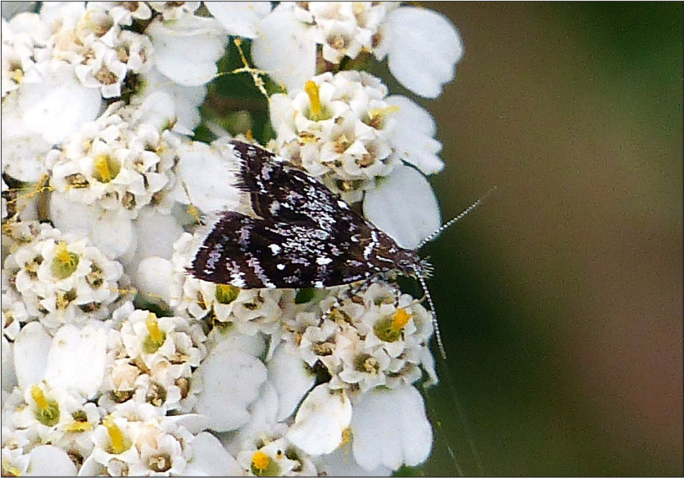
Ryc. 5. Prochoreutis myllerana (FABRICIUS, 1794), Piła, IX 2015.